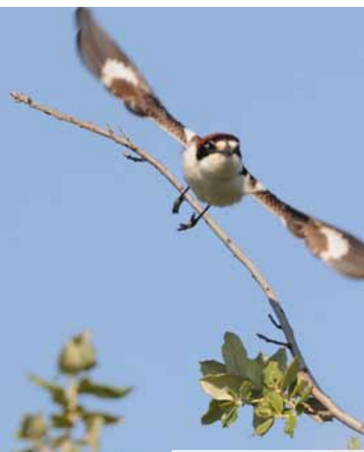
Pie-grièche à tête rousse

Un protocole standardisé de suivi des populations a été mis en place en 2014 dans trois secteurs où l'espèce est bien représentée (Plaine de Saône, bas Morvan méridional et Pays de Four). À la suite des prospections, 12 à 18 couples ont été estimés, avec des variations annuelles plus ou moins marquées. Bien qu'aucune tendance nette d'évolution des populations n'a pu ressortir localement, la raréfaction d'arbres dans les bocages laisse présager un déclin de l'espèce en Bourgogne.