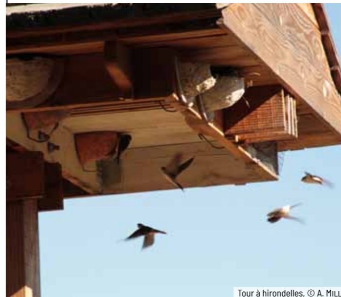
Tour à hirondelles, © A. MILLOT

Le Suivi temporel des oiseaux nicheurs par Échantillonnage ponctuel simple (STOC-EPS) est un programme national de suivi des oiseaux communs, initié par le Muséum national d'Histoire naturelle et coordonné à partir de 2008 par l'EPOB en Bourgogne. Jusqu'en 2018, la SHNA-OFAB a pris en charge 14 carrés, répartis principalement dans la Nièvre. Entre 2002 et 2018, 243 carrés ont été suivis au moins une année par des bénévoles et des salariés. Les données récoltées ont permis d'analyser l'évolution de 68 espèces. Parmi elles, 31 sont en augmentation, 21 sont stables et 16 sont en déclin, dont la Tourterelle des bois, le Bruant jaune, l'Hirondelle rustique et la Pie-grièche écorcheur.