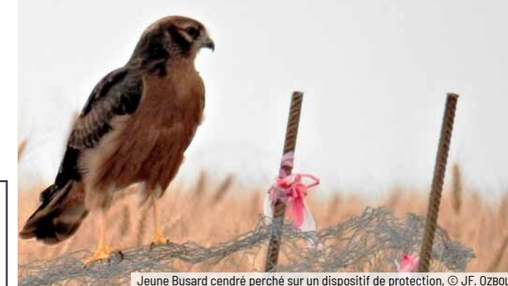
Jeune Busard cendré perché sur un dispositif de protection

Entre 2012 et 2017, un « SOS Oiseaux » coordonné par l'EPOB est mené pour répondre aux sollicitations des particuliers et collectivités. Il a reposé sur les associations membres de l'EPOB, leurs bénévoles et les centres de soins pour la faune sauvage. Plus de 1700 SOS oiseaux ont été recensés sur 544 communes bourguignonnes, avec une moyenne annuelle de 290 SOS. 79% des sollicitations concernaient des oiseaux blessés ou en difficulté, le plus souvent des jeunes tombés du nid, et 15% d'entre elles avaient pour origine des problèmes de cohabitation. Différents conseils et aménagements ont été mis en œuvre : deux tours à Hirondelle de fenêtre ont été construites sur le territoire du PNRM, l'une à Autun et l'autre à la Maison du parc (opération de sensibilisation sur les hirondelles et martinets lancée avec le PNRM en 2016) et plus de 30 animations ont été menées auprès de différents publics.