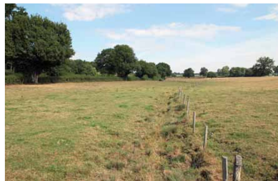
Ruisseau à sec.