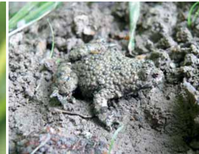
Sonneur à ventre jaune.