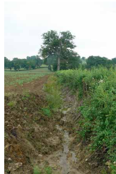
Cours d'eau curé.