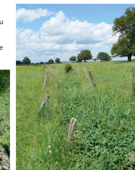
Ru clôturé à végétation basse.