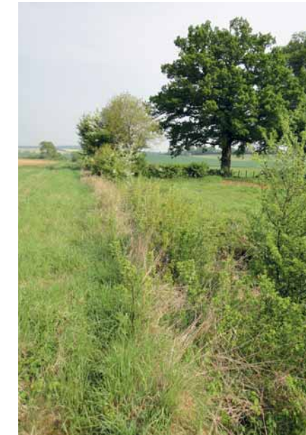
Fermeture du cours d'eau.

La disparition du pâturage ou l'absence d'entretien des berges peut entraîner une végétalisation rivulaire trop importante, rendant le cours d'eau inadéquat (d).