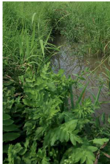
Végétation aquatique favorable.

La dénaturación du lit et des interventions trop agressives ou de grande envergure peuvent porter préjudice aux espèces. Le maintien de plantes aquatiques (e) et d'écoulements naturels sont des éléments importants pour leur cycle de vie.