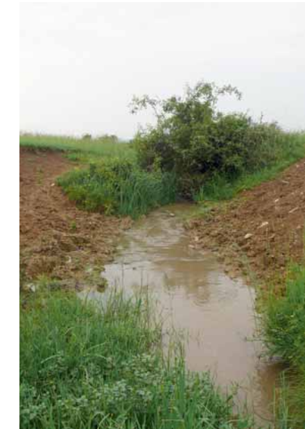
Enfoncement du lit.

L'enfoncement du lit artificialise le cours d'eau. Il perturbe le cycle de vie des agrions et induit aussi un impact sur les milieux terrestres proches des rives.