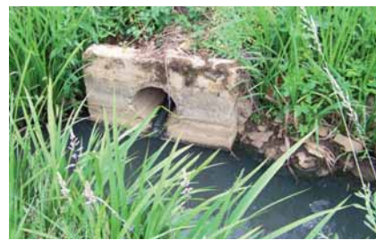
Dégradation de la qualité de l'eau.