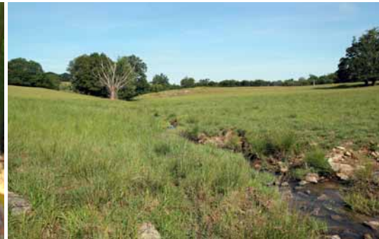
Ruisseau à agrions.

Habitat des adultes : Peu après leur transformation, les jeunes et les adultes se nourrissent, se reposent, se déplacent et s'accouplent dans les prairies plus ou moins proches des sources et ruisselets. Les prairies bocagères sont particulièrement favorables, mais une bande enherbée pourra compenser partiellement leur absence.