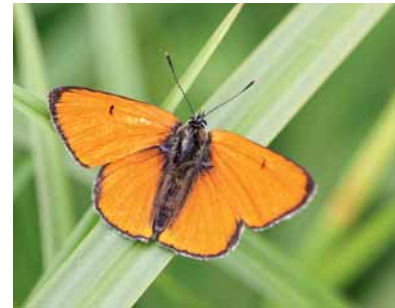
Cuivré des marais.