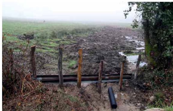
Canalisation d'un ruisseau.

Disparition (c), dégradation du milieu, de la qualité de l'eau, prélèvements excessifs et assèchement sont des problèmes récurrents pour la faune des milieux aquatiques de petite taille.