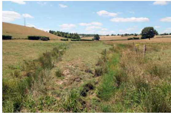
Prairie pâturée extensive, l'idéal pour les agrions.

Le milieu terrestre environnant le milieu aquatique est important, a minima une bande enherbée (a)... au mieux une prairie pâturée (b).