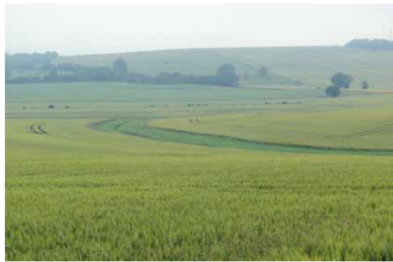
Bande enherbée entourant un ru parmi les cultures.