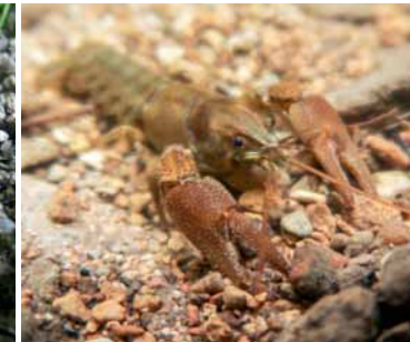
Écrevisse à pieds blancs.

D'autres espèces profitent des habitats favorables aux agrions (milieux aquatiques et zones humides attenantes) dont des espèces protégées comme le Cuivré des marais et le Sonneur à ventre jaune pour lesquelles les prairies et le pâturage lorsqu'il est mesuré sont bénéfiques.