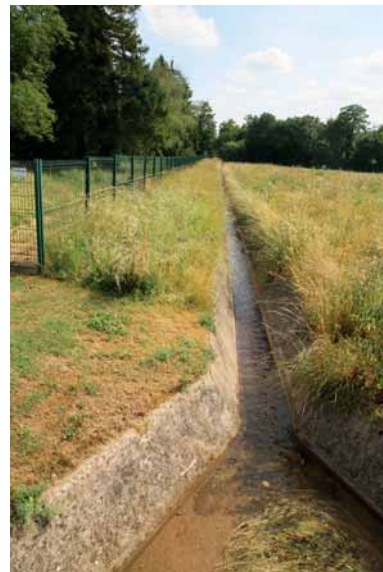
Cours calibré et chenalisé.