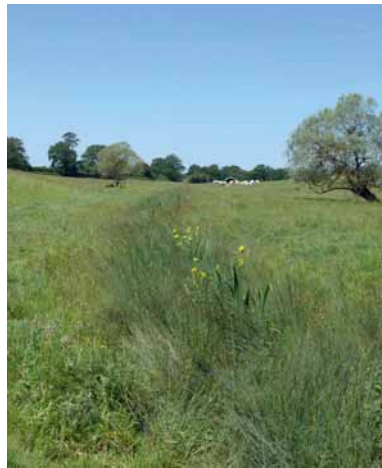
Ruisseau à agrions.

Habitat des adultes : Peu après leur transformation, les jeunes et les adultes se nourrissent, se reposent, se déplacent et s'accouplent dans les prairies plus ou moins proches des sources et ruisselets. Les prairies bocagères sont particulièrement favorables, mais une bande enherbée pourra compenser partiellement leur absence.