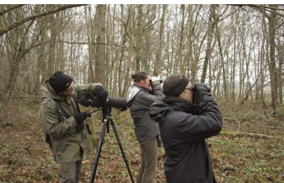
Observation « Oiseaux du Morvan »