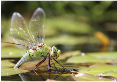
Étude des odonates, ici l'Anax empereur