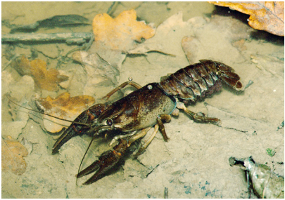
Suivis des populations d'Écrevisses