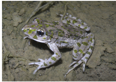
Préservation des populations de Pélodyte ponctué