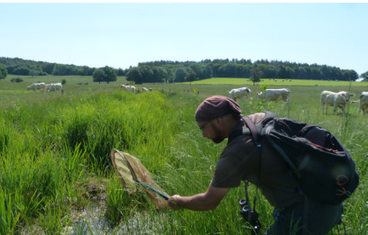
Inventaires scientifiques sur les espèces menacées

Partagez la connaissance et la préservation de la nature bourguignonne en participant aux groupes naturalistes.