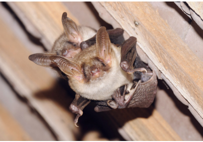
Suivis des 25 espèces de chauves-souris présentes en Bourgogne